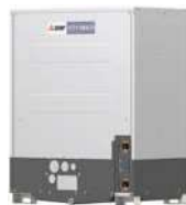
PQHY-P200YLM-A1 PQHY-P250YLM-A1 PQHY-P300YLM-A1