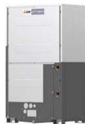
PQHY-P350YLM-A1 PQHY-P400YLM-A1 PQHY-P450YLM-A1 PQHY-P500YLM-A1 PQHY-P550YLM-A1 PQHY-P600YLM-A1