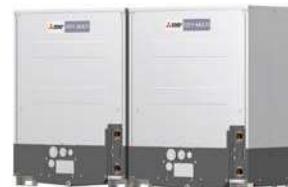
PQHY-P400YSLM-A1 PQHY-P450YSLM-A1 PQHY-P500YSLM-A1 PQHY-P550YSLM-A1 PQHY-P600YSLM-A1