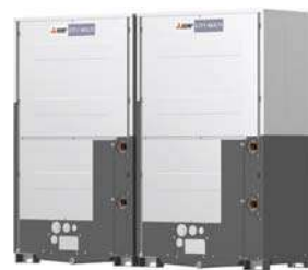
PQHY-P700YSLM-A1 PQHY-P750YSLM-A1 PQHY-P800YSLM-A1 PQHY-P850YSLM-A1 PQHY-P900YSLM-A1